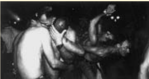
SLIKA 6.3.: SEKSUALIZACIJA ( Mladina , 12. JUNIJ 2000)