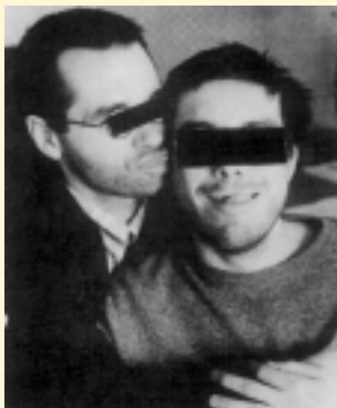
SLIKA 7.3.: SKRIVNOST ( Mladina , 20. OKTOBER 1992)