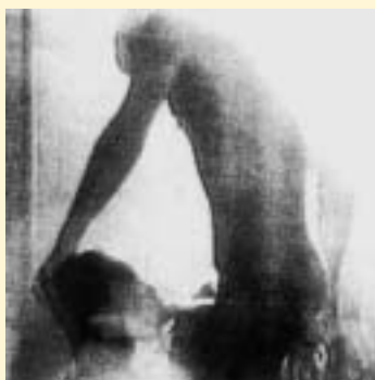
SLIKA 6.1.: SEKSUALIZACIJA ( Slovenske novice , 30. DECEMBER 1992)

Tudi drugi primer seksualizacije homoseksualnosti z grafično opremo besedil je vzet iz Slovenskih novic . Članek »Tiho priznanje drugačnosti« iz leta 1995 je opremljen s sliko dveh moških, ki se poljubljata. Eden od njiju je do pasu gol, hkrati pa ima tudi odpete hlače, izza njih pa je moč videti bele spodnjice (in na njih napis Calvin Cline). Slika izpričuje veliko več kot le ljubezensko razmerje med dvema moškima, saj odnos prikaže kot predvsem seksualen. Golo telo, odpete hlače in spodnjice so namreč povsem očitna aluzija na seksualnost.