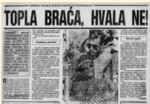
SLIKA 3.1.2.1 TOPLI BRATCI, NE, HVALA!