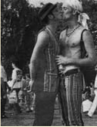
SLIKA 6.2.: SEKSUALIZACIJA ( Slovenske novice , 22. AVGUST 1995)

Tretji primer seksualizacije homoseksualnosti smo vzeli iz reportaže Mladine o pohodu gejevskega in lezbičnega ponosa v Rimu »Brez seksa na ulicah«. Reportaža je med drugim opremljena s sliko treh moških, golih do pasu, ki se poljubljajo, v ozadju pa sta še dva moška, ravno tako gola do pasu, s hrbtom obrnjena drug proti drugemu. Slika je naslovljena s podpisom »Gay olimpiada v Amsterdamu leta 1998« in celotno dogajanje na olimpiadi reducira na gola telesa v diskoteki, seks in promiskuiteto.