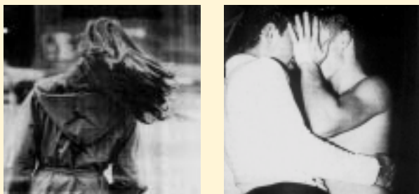
SLIKA 7.2.: SKRITI OBRAZI – OSEMDESETA IN DEVETDESETA ( Jana , 11. NOVEMBER 1981, IN Mladina , 13. NOVEMBER 2000)

Zgovorna je tudi slika, objavljena v Mladini leta 1992, na kateri sta dva moška (»modela Mladine «), eden poljublja drugega na lice, čez njune oči pa je nalepljen črn trak, ki aludira ne samo na skrivnostnost, pač pa tudi na kriminaliteto, saj so take slike pogosto objavljene na časopisnih straneh kronike.